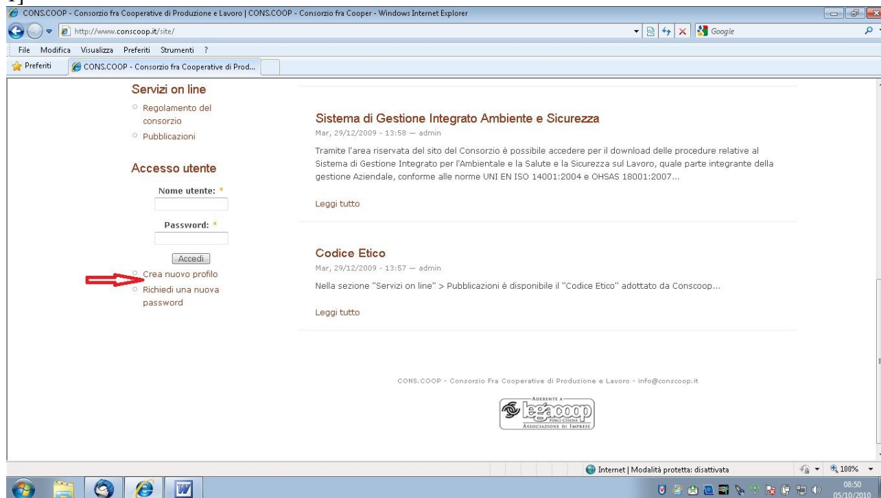
Fig. 1 – crea nuovo profilo

1) dal sito www.conscoop.it , selezionare <crea nuovo profilo> nella sezione <Accesso utente> [Fig. 1]